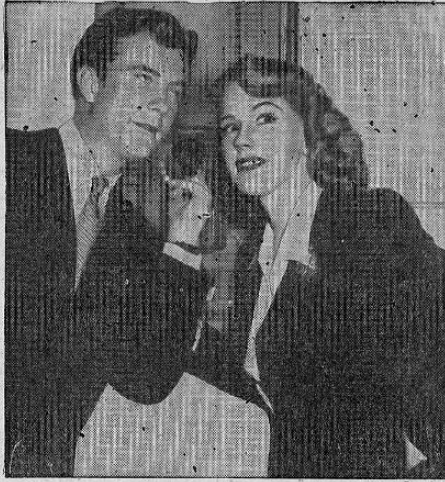
No hay nada significativo en el fin RKO radio, "Sígueme en silencio". El es un detective de la policía y ella es una reporter políciaca.