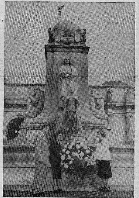
En la Plaza "Union Station" de la ciudad de Washington, se levanta este Monumento en memoria de Cristóbal Colón, Descubridor de América. Este monumento es muy visitado el 12 de octubre, fecha del descubrimiento del Nuevo Mundo.